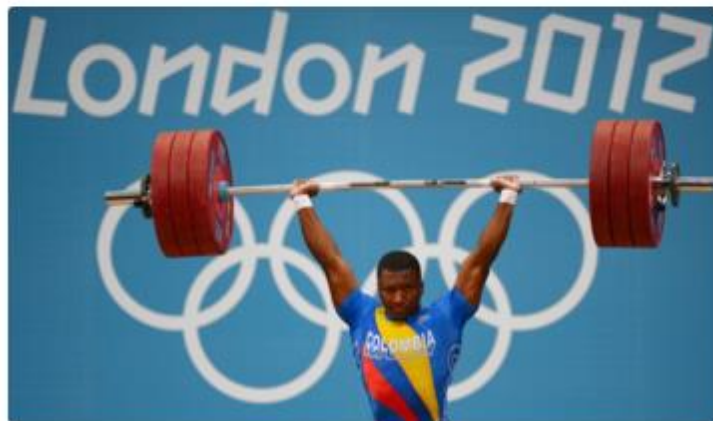
Oscar Figueroa ganhou a medalha de prata nos Jogos London 2012

La página oficial de Rio 2016 homenajeó las técnicas de meditación utilizadas por el pesista colombiano Oscar Figueroa para buscar una presea dorada en los Juegos Olímpicos de Río 2016.