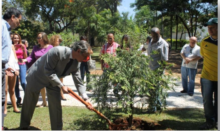
Embajada y Consulado de Colombia en Brasilia

Se trató de actos que los Consulados de Colombia en todo el mundo realizaron junto con los connacionales, incluidas algunas víctimas, para brindar apoyo en el nuevo proyecto de vida que las personas afectadas por la violencia han de emprender hacia la reparación, una vez finalice el conflicto.