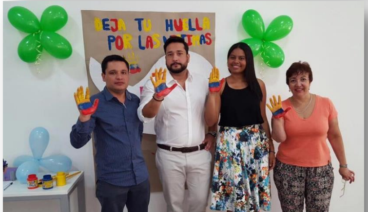
Consulado de Colombia en São Paulo