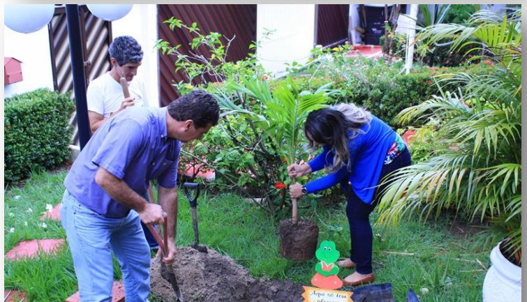
Consulado de Colombia en Manaus